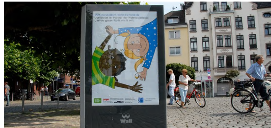
Werbung in Düsseldorf*

Städte nutzen ihre Werbeflächen oder andere Plattformen, um ihren Einsatz für eine Welt ohne Hunger zu zeigen. Künstler*innen, Grafiker*innen u.a. können sich kreativ einbringen