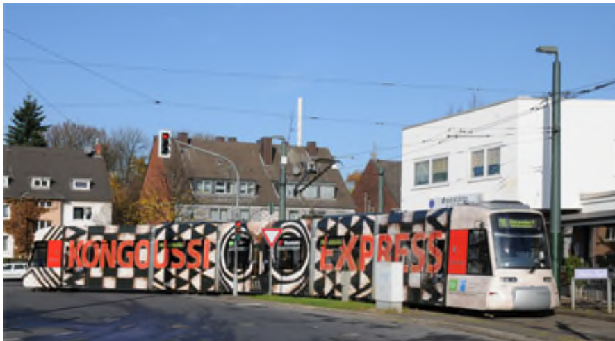
Der „Kongoussi-Express“ zur Partnerschaft mit Düsseldorf*