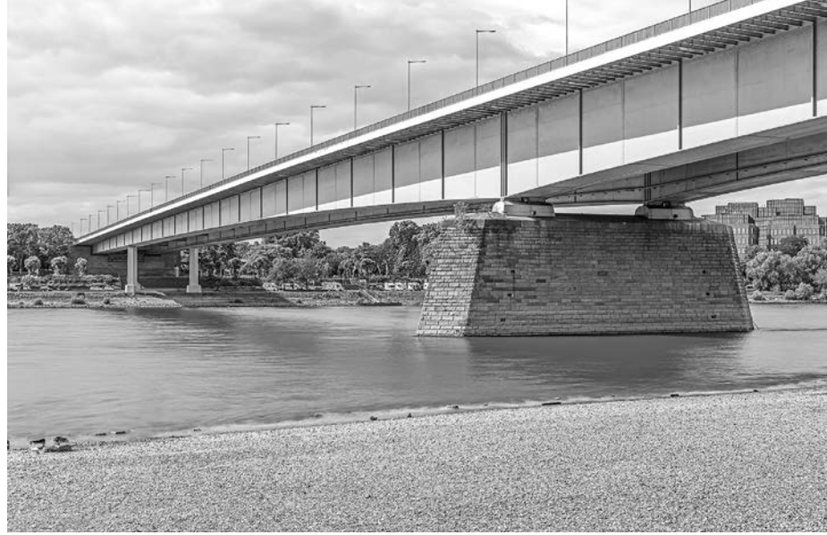
Zoobrücke in Köln