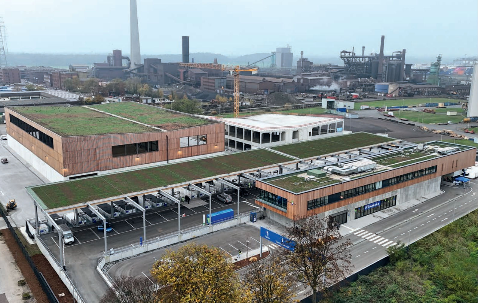
Wirtschaftsbetriebe Duisburg