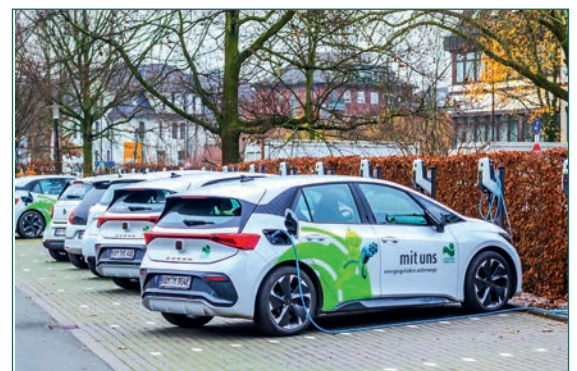
Ladestationen in Hamm