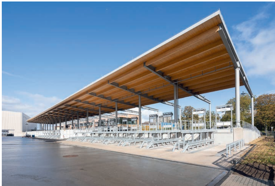
Betriebshof Hochfeld

Nach dem Re-Use-Rechner des ifeu-Instituts und der Berliner Senatsverwaltung konnten dadurch potenziell rund 40 Tonnen