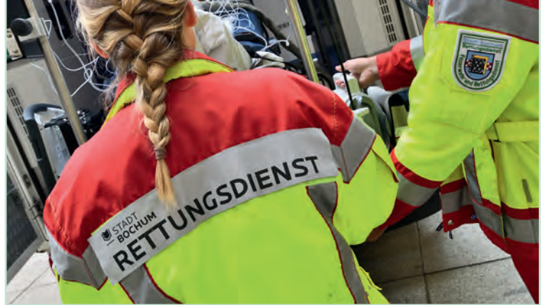
Rettungsdienst der Feuerwehr in Bochum