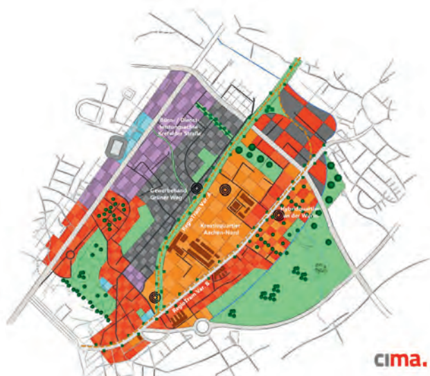
Zonierung Aachen-Nord (Grafik CIMA Beratung + Management GmbH)

In Aachen-Nord bietet sich derzeit für die zweite Gründung ein Potenzial von über 390.000 m 2 nicht bzw. mindergenutzter Fläche, das ist so viel wie an keiner anderen Stelle im Aachener Stadtgebiet. Aus dem einstigen reinen Gewerbe- und Arbeiterstandort kann sich durch die Gestaltung öffentlicher Wege, Plätze, Grün- und Freiräume, durch moderne Unternehmen sowie Smart City-, Mobilitäts- und Infrastrukturkonzepte ein lebendiges, nachhaltiges und vernetztes Quartier entwickeln, welches die Anforderungen an eine veränderte Arbeitswelt und die Prinzipien der Nachhaltigkeit berücksichtigt.