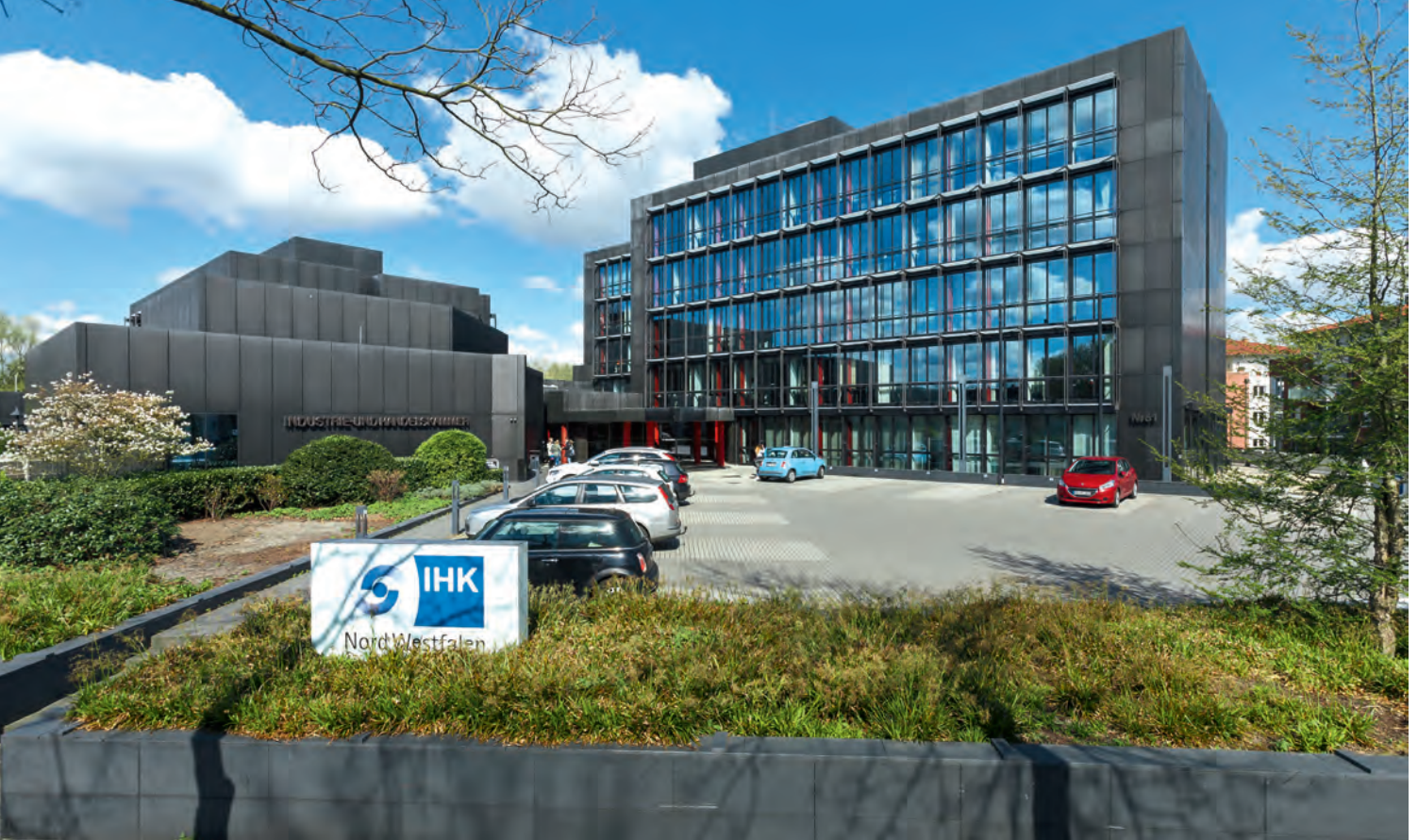
Die IHK Nord Westfalen in Münster ist im Münsterland und der Emscher-Lippe-Region engagiert im Ausbildungskonsens NRW