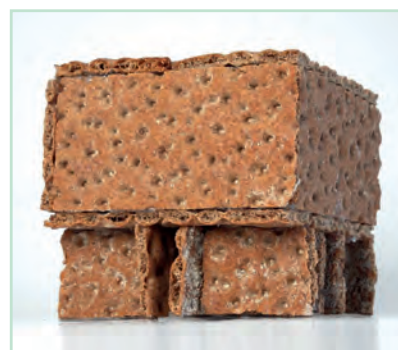
Nachbau der Kunsthalle Bielefeld

https://baukunstarchiv.nrw/2021/11/19/baukunstbuffet