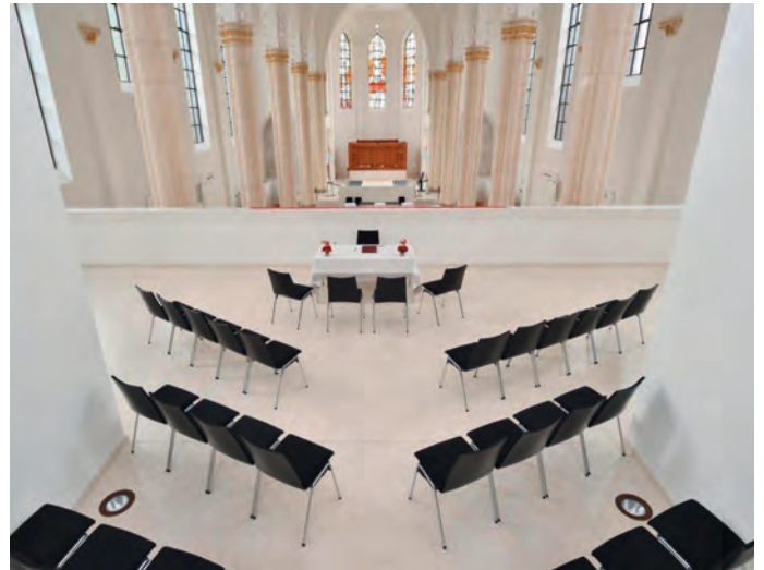
Innenraum des Anneliese Brost Musikforums Ruhr

Das Anneliese Brost Musikforum Ruhr ist seit 2016 das Zuhause für die Bochumer Symphoniker und bietet darüber hinaus mit Konzerten des Ensembles der Musikschule oder des Jugendsymphonieorchesters ein abwechslungsreiches musikalisches Programm. Neben dem musikalischen und architektonischen Aspekt ist das Foyer nun auch außergewöhnlicher Trauort. Im Trauzimmer auf der Empore im früheren Schiff der Marienkirche können sich Bochumerinnen und Bochumer das Ja-Wort geben und so an einem der faszinierendsten Orte der Stadt den Bund der Ehe schließen. Damit kann man in einer Kirche heiraten, ohne kirchlich zu heiraten.