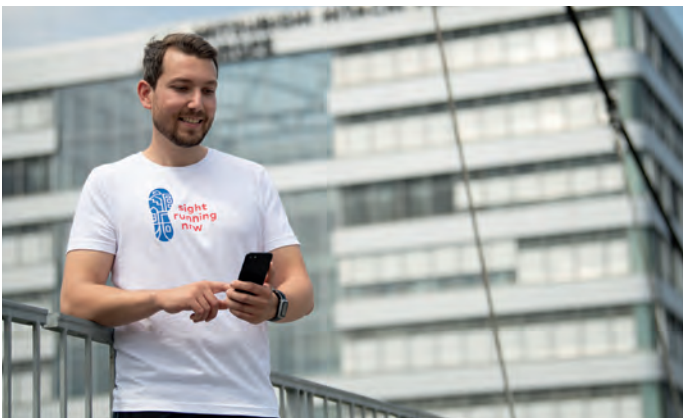
Jede Route steht unter einem Leitthema

Der Nutzer der App bekommt während des Laufs über den Audioguide automatisch ortsbezogene Informationen über einzelne Bauwerke und baukulturelle Highlights ausgespielt. Im Schnitt wird auf jedem Kilometer ein Objekt per GPS-Erkennung vorgestellt, sobald sich die Sportlerin bzw. der Sportler dem Bauwerk nähert.