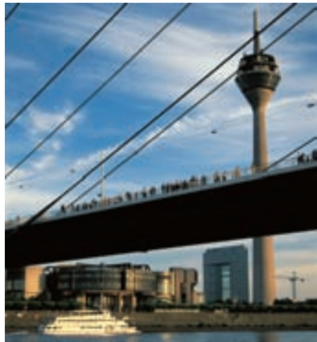
Düsseldorfer Landtag mit Staatskanzlei und Fernsehturm

Der Städtetag Nordrhein-Westfalen ist ein Landesverband des Deutschen Städtetages.