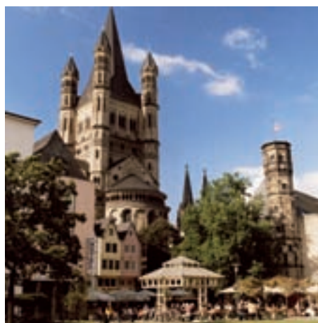
Köln - Sitz des Städtetages Nordrhein-Westfalen

1950 Umbenennung in „Städtetag Nordrhein-Westfalen“